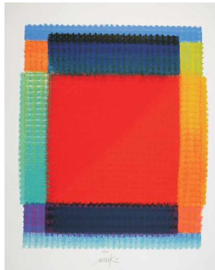
Ikone mit rotem Feld, 2007 Druck mit 25 Sieben auf Bütten 70,5 x 57,0 cm, Aufl.: 70 Expl.

geöffnet: Di., Fr., Sa. 10:00 -13:00 Uhr, Do. 15:00 -20:00 Uhr, So. 15:00 -18:00 Uhr