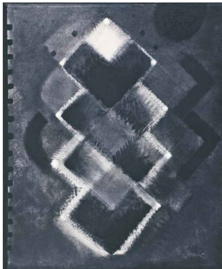
Sternkonstellation, 2000 Acryl auf Leinwand 164 x 133 cm

Aspekte des malerischen Werkes im KUNSTRAUM Langenfeld Hauptstrasse 135, 40764 Langenfeld